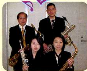
(Saxophone Ensembleなごみさん) ホームページ http://www.geocities.jp/ensemble.nagomi/