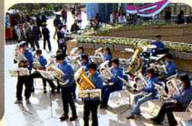
ユーフォニウム・ティーン演奏集団 Eふれんずさん